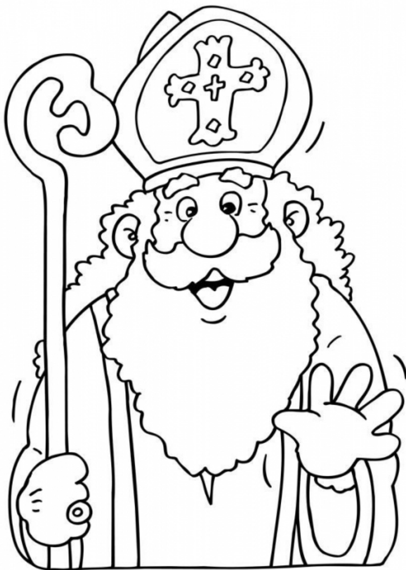
Père Noel, Sinterklaas, Nikolaus zum Ausmalen